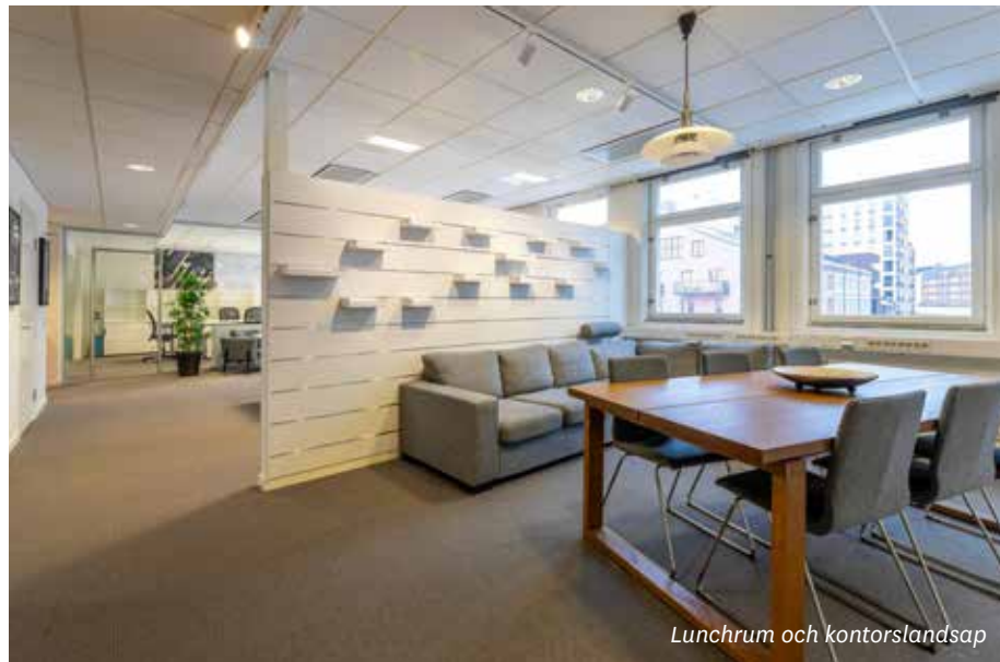
Lunchrum och kontorslandskap