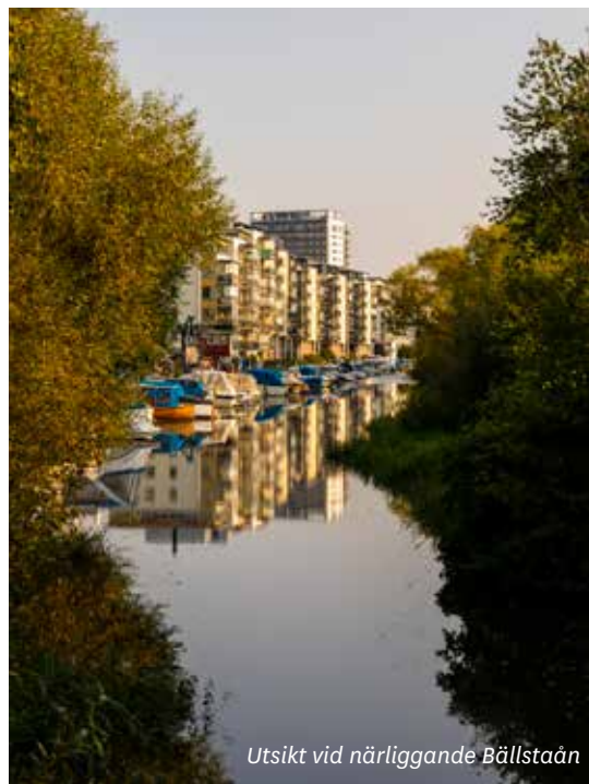
Utsikt vid närliggande Bällstaån