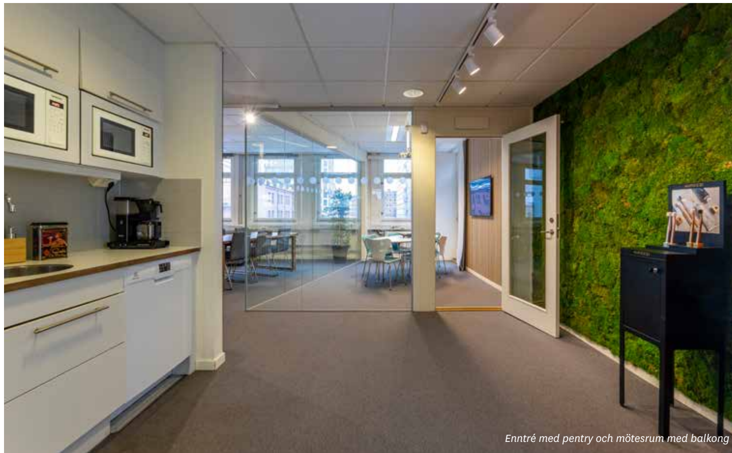
Entré med pentry och mötesrum med balkong