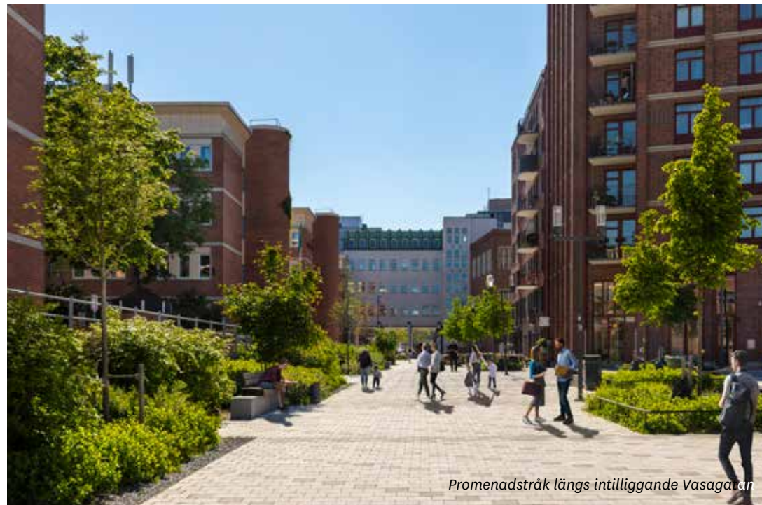
Promenadstråk längs intilliggande Vasagatan