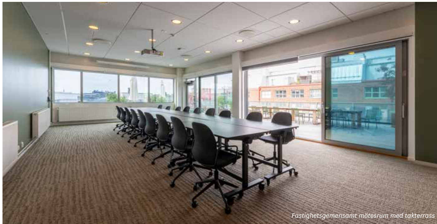
Fastighetsgemensamt mötesrum med takterrass