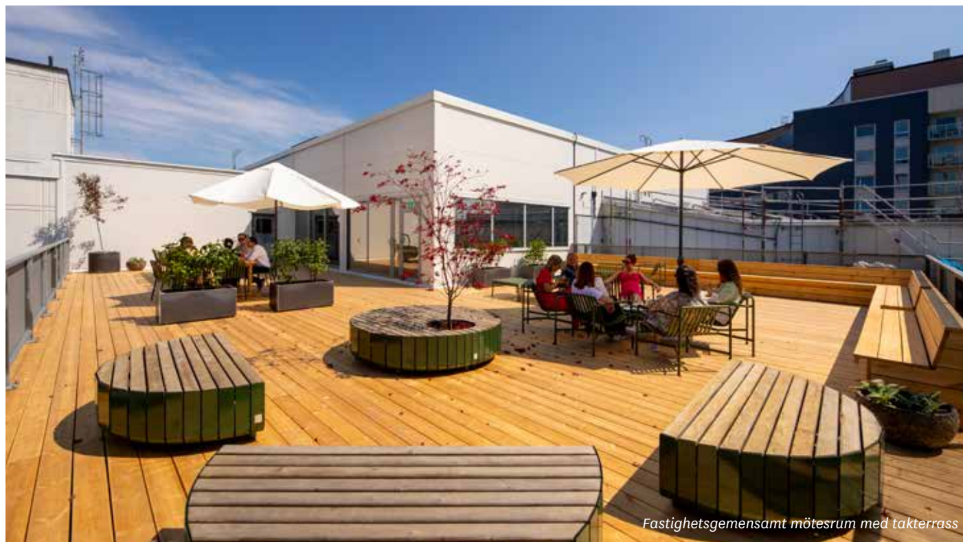
Fastighetsgemensamt mötesrum med takterrass