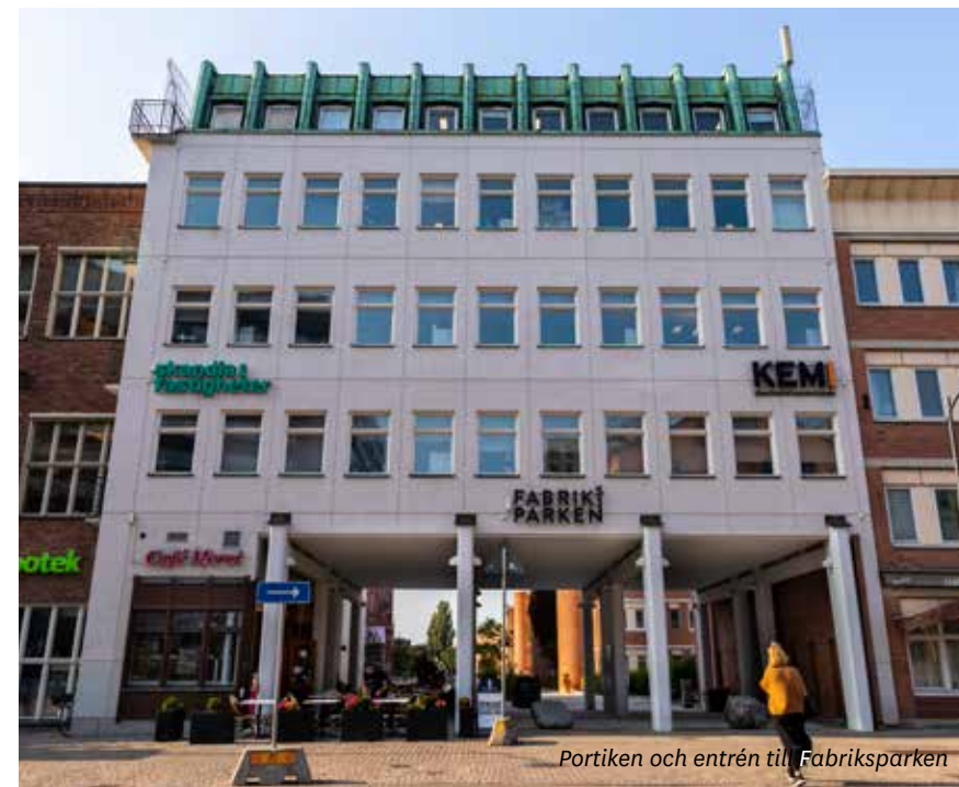
Portiken och entrén till Fabriksparken