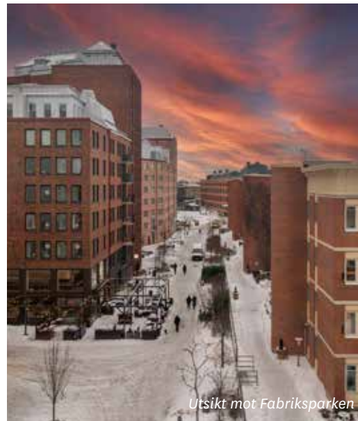
Utsikt mot Fabriksparken