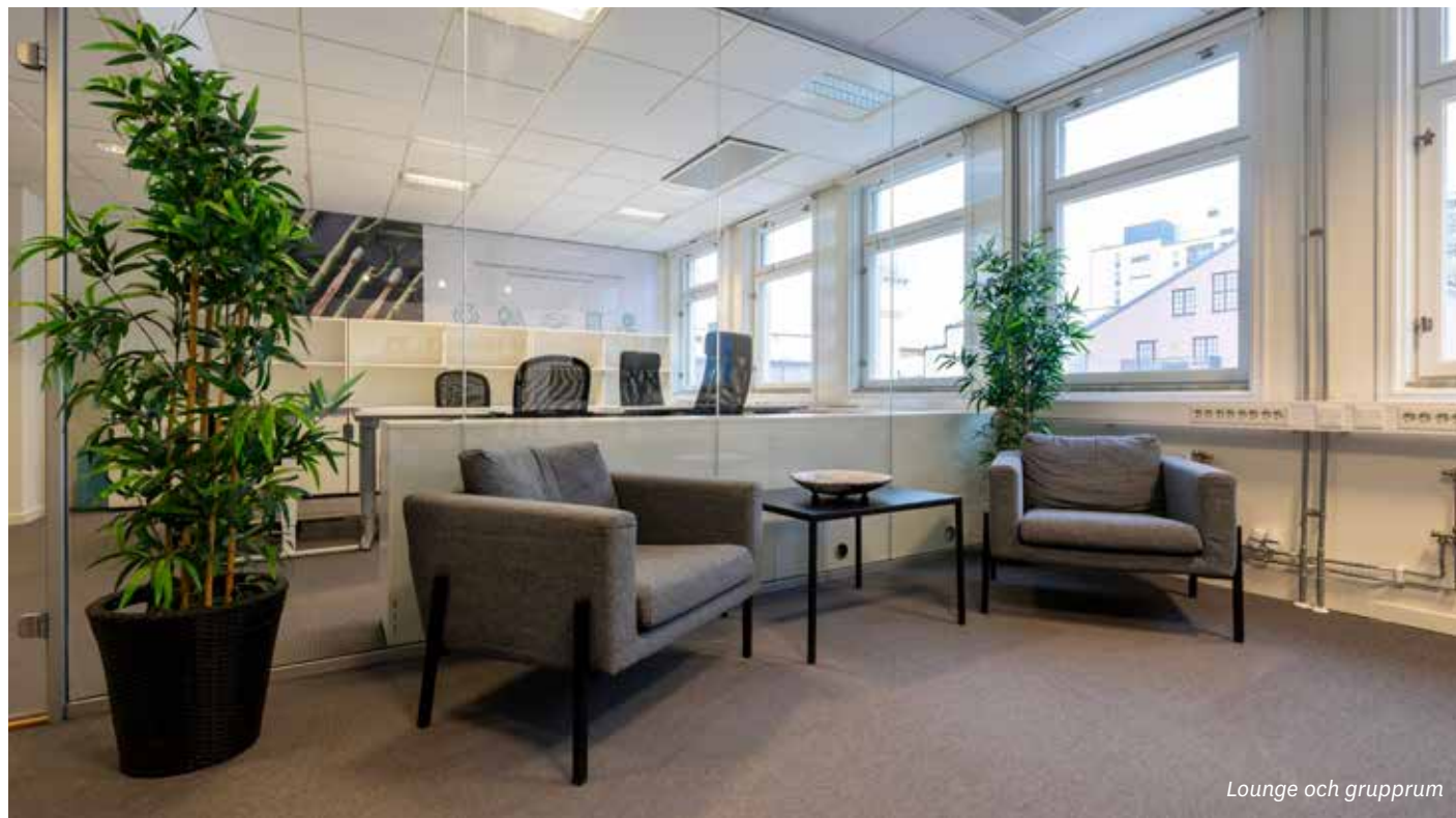
Lounge och grupprum