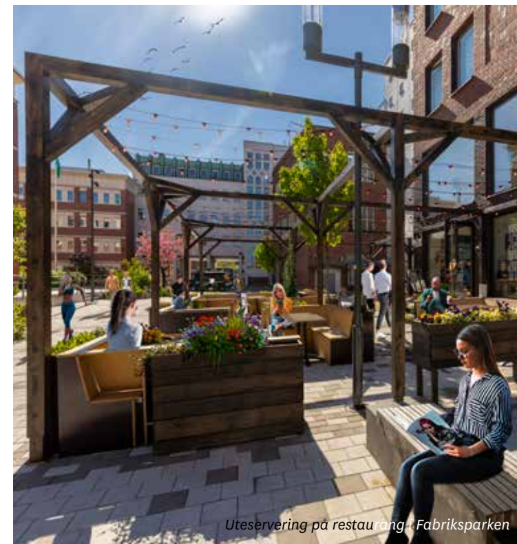
Uteservering på restaurang i Fabriksparken