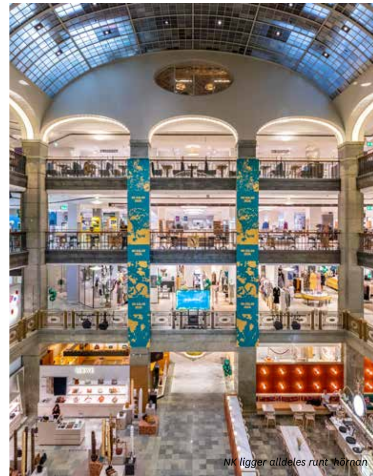
NK ligger alldeles runt hörnan