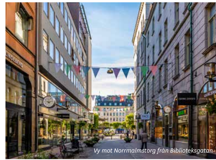
Vy mot Norrmalmstorg från Biblioteksgatan