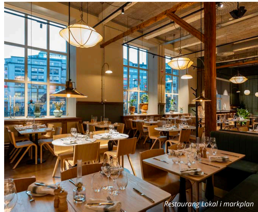
Restaurang Lokal i markplan