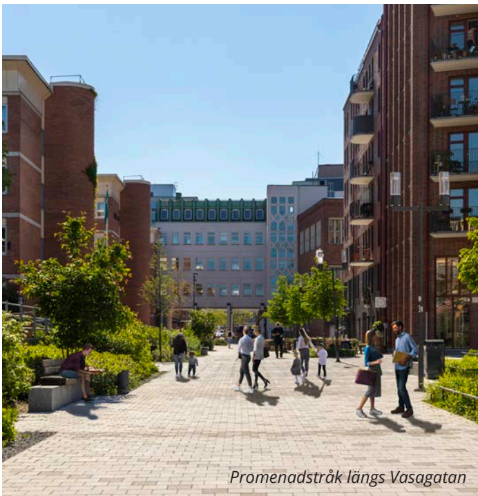
Promenadstråk längs Vasagatan