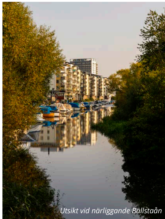
Utsikt vid närliggande Bällstaån