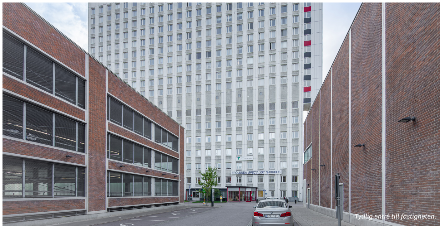
Fydlig entré till fastigheten.