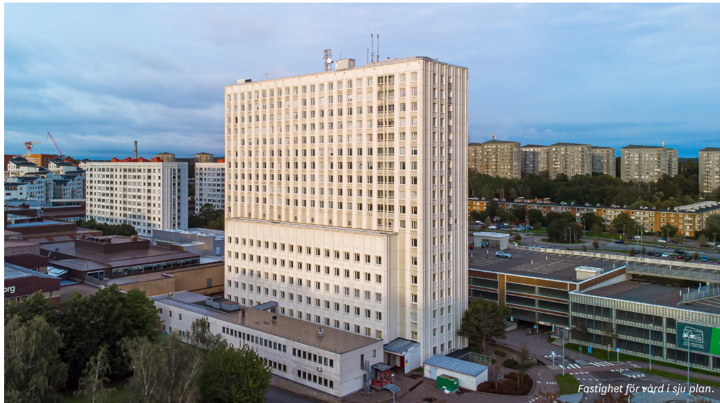
Fastighet för vård i sju plan.