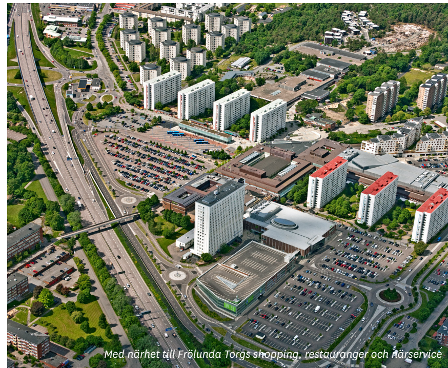
Med närhet till Frölunda Torgs shopping, restauranger och närservice