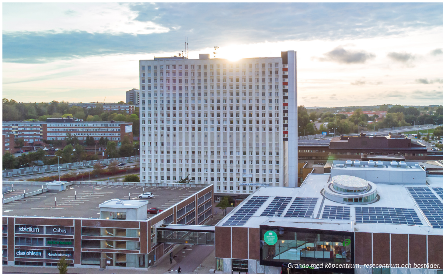
Granne med köpcentrum, resecentrum och bostäder.