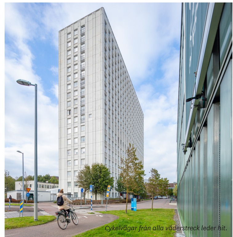
Cykelvägar från alla väderstreck leder hit.