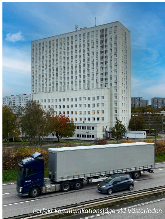
Perfekt kommunikationsläge vid Västerleden